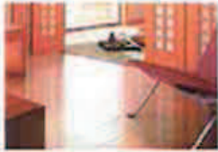
●バリアフリーリフォーム

太陽光発電やLED、断熱など、環境に優しく経済的なリフォームをご提案いたします。